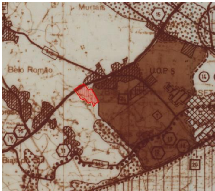
Fig 3 – Extrato da Planta de Ordenamento do PDM

Na Planta de Ordenamento do PDM, o PP abrange a seguinte classe de espaço: