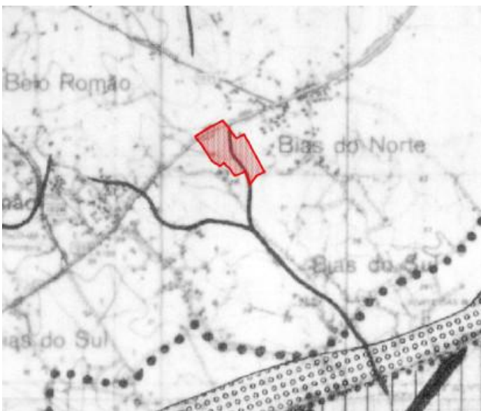
Fig 5 – Extrato da Planta de Condicionantes do PDM – Servidões Especiais

Apresenta-se no entanto, uma condicionante de linha de água, sendo também integrada na REN.