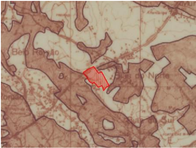
Fig 4 – Extrato da Planta de Condicionantes do PDM - RAN

Apresenta-se no entanto, uma condicionante de linha de água, sendo também integrada na REN.